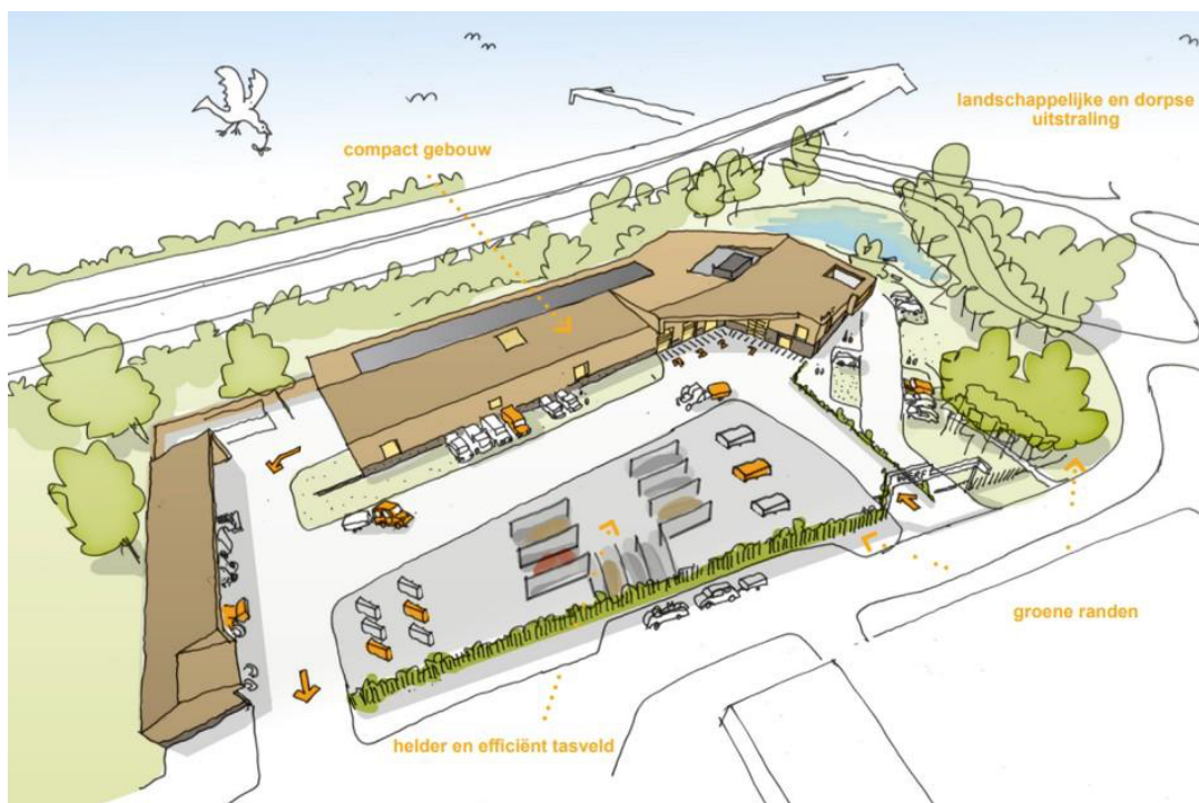
Ontwerpschets beoogde ontwikkeling nieuwe gemeentewerf gezien vanaf de oostzijde (Bron: bdg architecten).