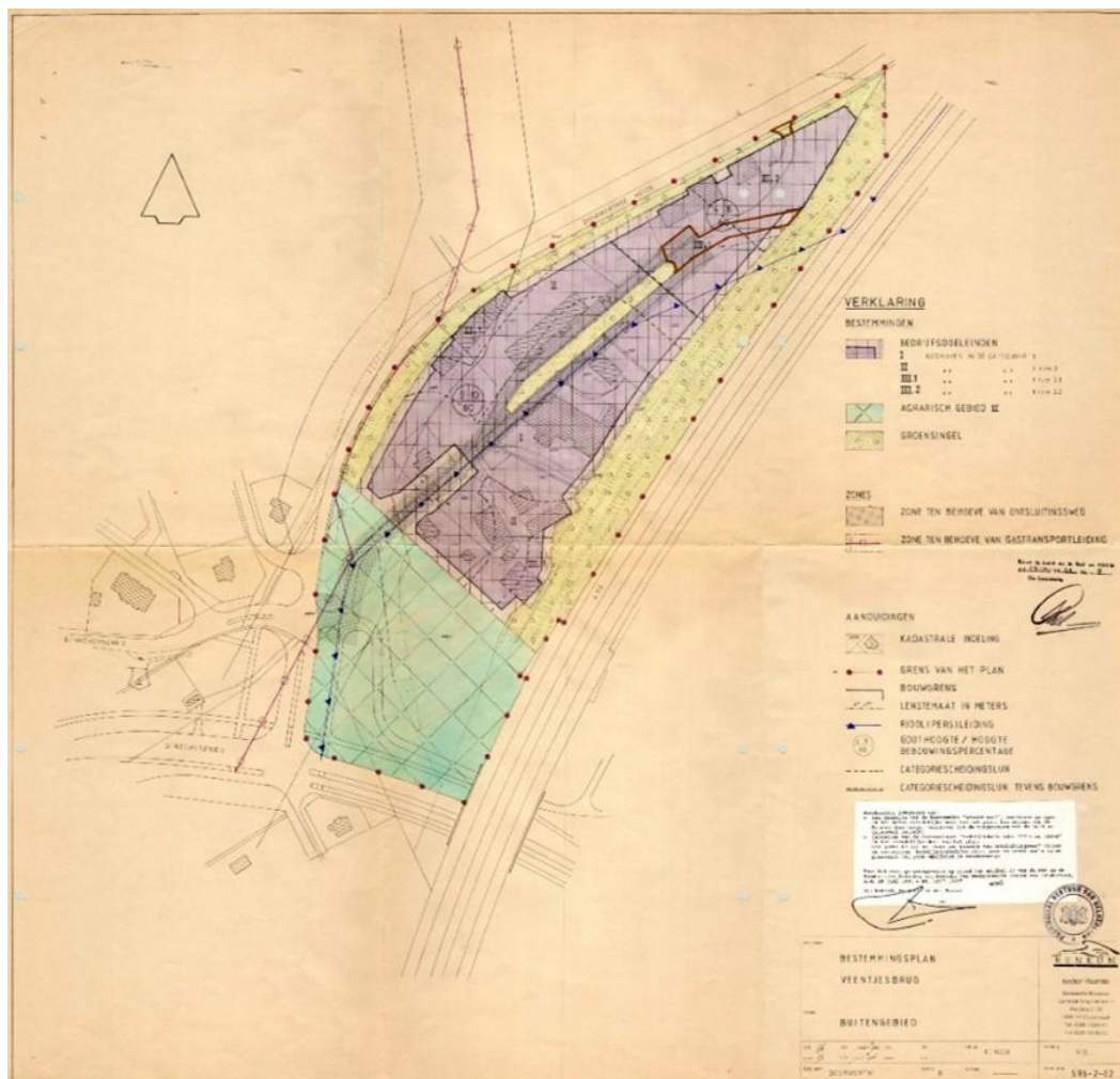
Afbeelding: Verbeelding bestemmingsplan 'Veentjesbrug' (uit 1999)

Het nieuwe TAM-omgevingsplan zorgt voor een juist bouwvlak en bestemming om de gemeentewerf mogelijk te kunnen maken.