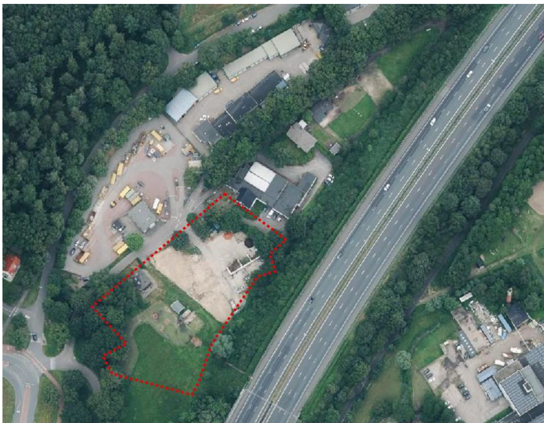
Luchtfoto van de huidige situatie met daarop het plangebied globaal rood omlijnd.